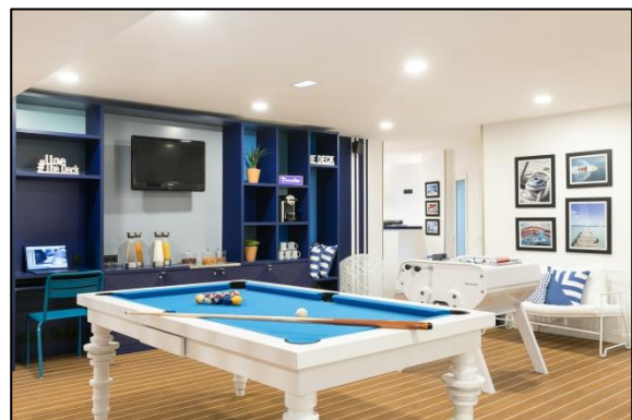
Le Salon Billard

Chaque client peut également vivre l'expérience HappyCulture en ville en se rendant dans les autres hôtels niçois du groupe. Avec sa clef de chambre, il peut en effet se rendre dans chacun des 8 établissements azuréens pour profiter des services proposés à savoir wifi, service de conciergerie, café en libre-service, bagagerie, prêt de parapluies et de chargeurs de téléphone ou encore la location de WIFI Pockets 4G leur permettant de rester connecté et partager leurs photos de vacances en instantané durant tout leur séjour