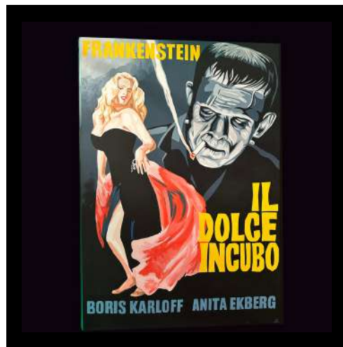
Exposition Clap & Pop / Pop Art Galerie